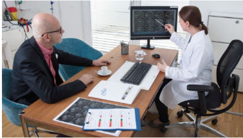
Ärztin erklärt dem Patienten die Untersuchungsergebnisse.