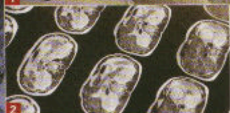
1. Reise ins Innere des Körpers mit MRT 2. Es werden tausende Schnittbilder des Körpers gemacht 3. Diese ermöglichen eine Beurteilung von Gefäßen und Organen des Körpers

dieser vor allem nur das kleine Blutbild vorgelesen, wir setzen beim 'Total Body Scan' jedoch auf das große Blutbild", erläutert Allgemeinmediziner Wegmann ihr. „Hinzu kommen Spezialtests, die sich aufgrund des Anamnesegesprächs für sinnvoll erweisen. So können z. B. Schilddrüsen-, Leberfunktions- und Cholesterinwerte, Elektrolyt- und Mineralstoffhaushalt, Hormonstatus und Tumormarker überprüft werden.“